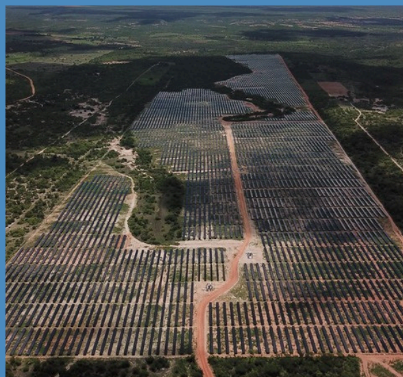
Usina Fotovoltaica Assú V gera cerca de 9.240 kW/h por dia

Ao todo, 10 fiscais vão se dividir para fiscalizar obras e serviços em 15 cidades destas inspetorias.